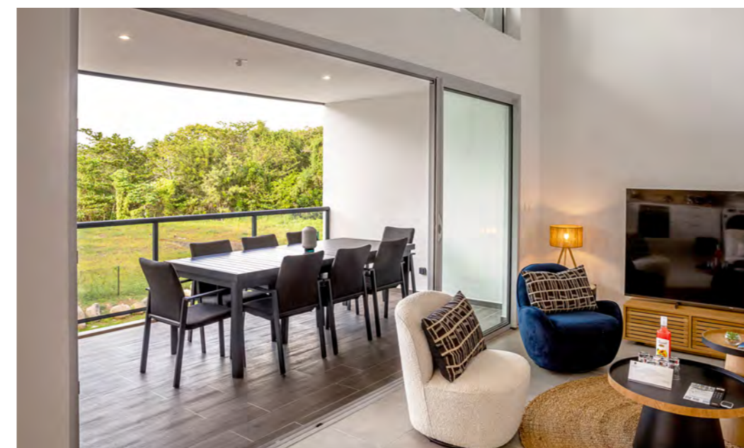
T4 | 3 chambres | Duplex | 105m 2

LES 36 APPARTEMENTS MEUBLÉS SONT RÉPARTIS ENTRE PLUSIEURS BÂTIMENTS DE 2 À 3 ÉTAGES À L'ARCHITECTURE ÉLÉGANTE FACE À LA BAIE DE FORT-DE-FRANCE.