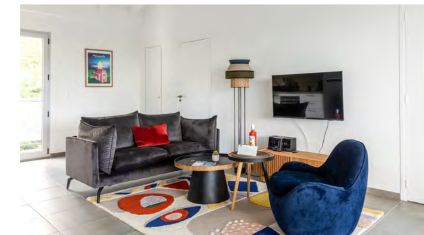
T2 | 1 chambre | de 40m 2 à 49m 2