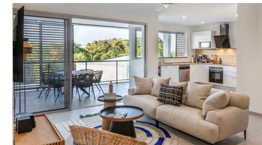
T3 | 2 chambres | de 51m 2 à 68m 2